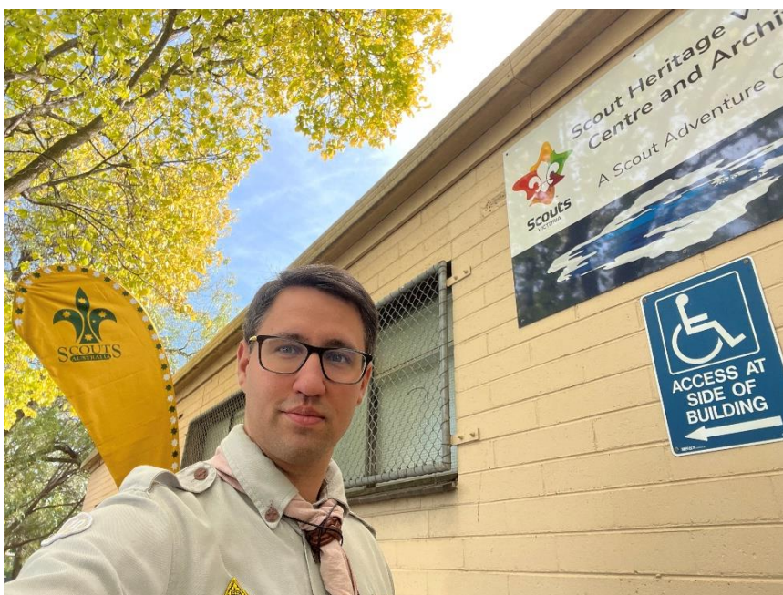
Részvétel az Scout Heritage Victoria nyílt napján 2025. május 4.