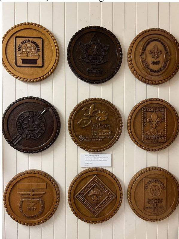
A Scout Heritage Victoria gyűjteményének egy apró részlete, mely doktori kutatási témámhoz kapcsolódik. A nemzetközi cserkész világtalálkozók emléklakettjeinek képe.