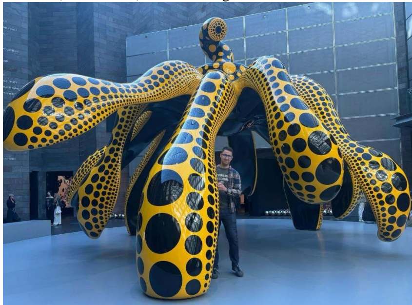
A National Gallery of Victoria (NGV) Yayoi Kusama időszaki kiállításának látogatásakor.