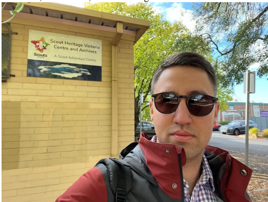
Fogadószervezetem a Scout Heritage Victoria Centre and Archives előtt a mobilitás kezdetén.