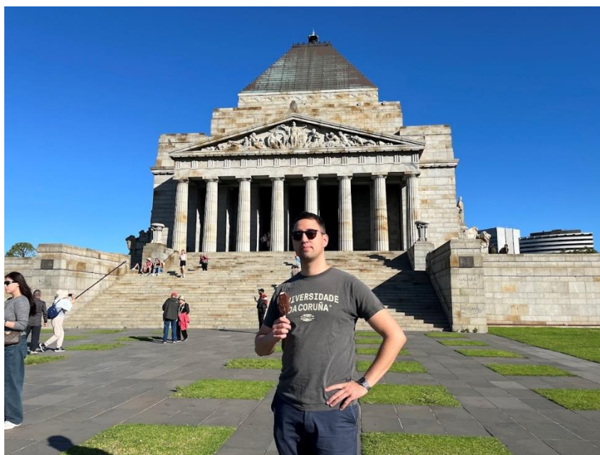
Márciusban még fagyis idő volt Melbourne-ben, a Shrine of Remembrance múzeum és nemzeti emlékhely látogatásakor.