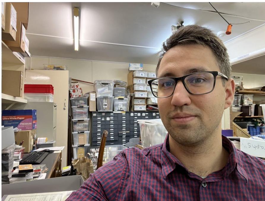
Egy átlagos munkanapon gyakorlati helyemen a Scout Heritage Victoria irodájában, éppen az újonnan beérkezett iratanyag szortírozását végzem.