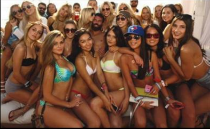
WHAT MY FRIENDS THINK I DO