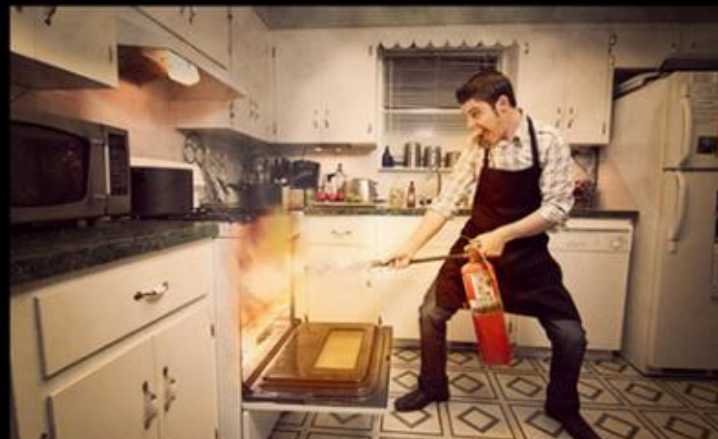
WHAT I REALLY DO